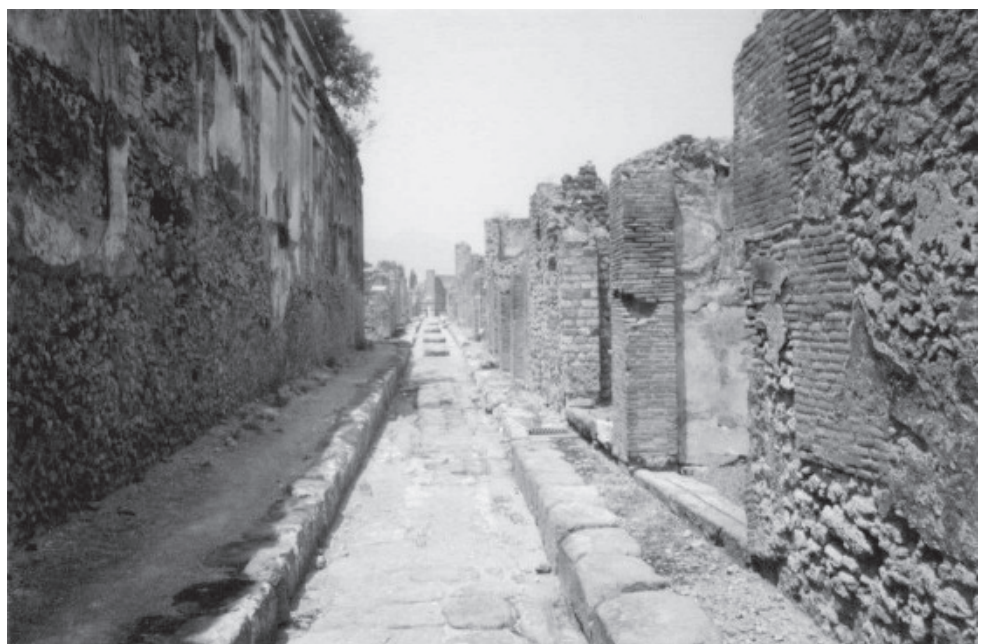
Een van die langste strate in Pompeji. Let op die sygaardjies.

Ons dink aan die woord van Jesus: “En jy, Kapernaüm, wat tot die hemel toe verhoog is, jy sal tot die doderyk toe neergestort word, want as in Sodom die kragtige dae plaasgevind het wat in jou plaasgevind het, sou hy bly staan het tot vandag toe” (Matteus 11:23). Ook Pompeji, soos Sodom, het nie bly staan nie. En ons stad waar daar steeds “kragtige dae” van Christus plaasvind - die preke? Verstaan ons nog iets van God se oordeel oor die sondige wêreld?